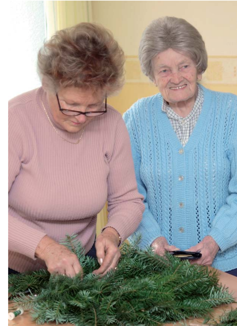
Endlich genügend Platz für Bastelarbeiten im neuen Aufenthaltsbereich