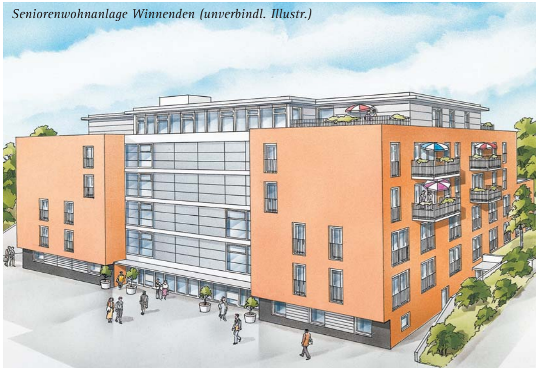
Seniorenwohnanlage Winnenden (unverbindl. Illustr.)

Ob zur eigenen Nutzung, zum Erwerb für nahe Angehörige oder als vorsorgende Kapitalanlage – der Kauf einer Seniorenwohnung ist eine lohnende Investition.