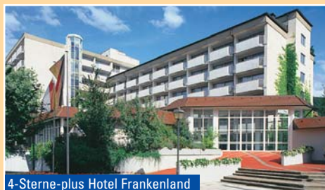
4-Sterne-plus Hotel Frankenland

handlungen, Massagen und Thalasso (frühzeitige Reservierung im Hotel erforderlich). Das Haus hat eine eigene, unter ärztlicher Leitung stehende Kurabteilung. (Hotel- und Freizeiteinrichtungen teilweise gegen Gebühr.)